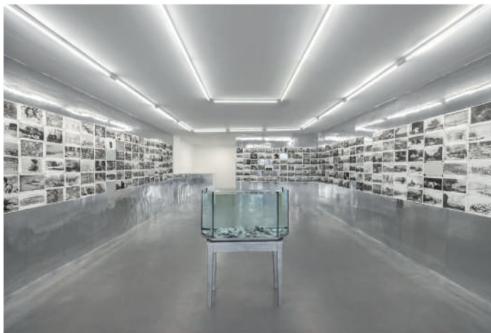
..... L'exposition « Liquidation Totale » de la galerie Pal Project jusqu'au 10 novembre. (Pour liquidation totale)